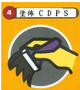
4 塗佈 CDPS